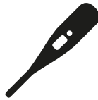
Verhoging of koorts